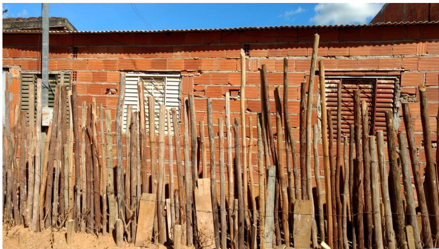
Figura 1. Registro fotográfico da visita.

No dia 10/06/2017, equipe técnica da empresa Synergia, enviou SMS para os números declarados pelo manifestante, com o objetivo que a família entre em contato com a empresa para realização do Cadastro Integrado.